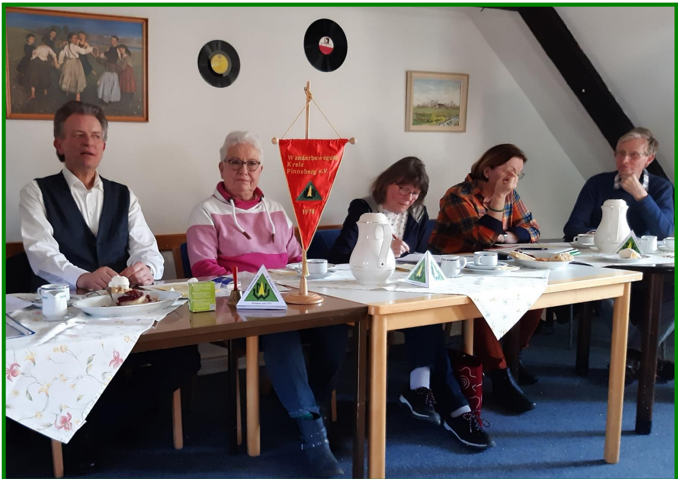
Die Vorstandsmitglieder (Kassenwartin außerhalb des Bildes) bei der JHV am 28.02.2023