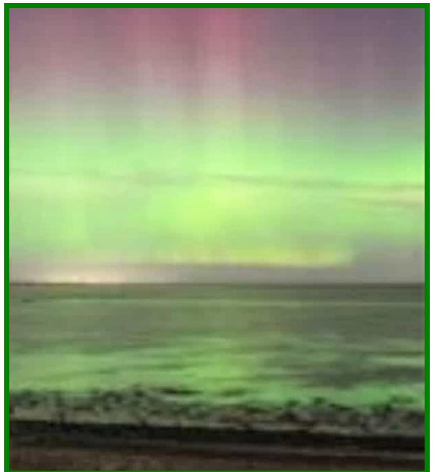
Wetterleuchten auf Pellworm im März 2023