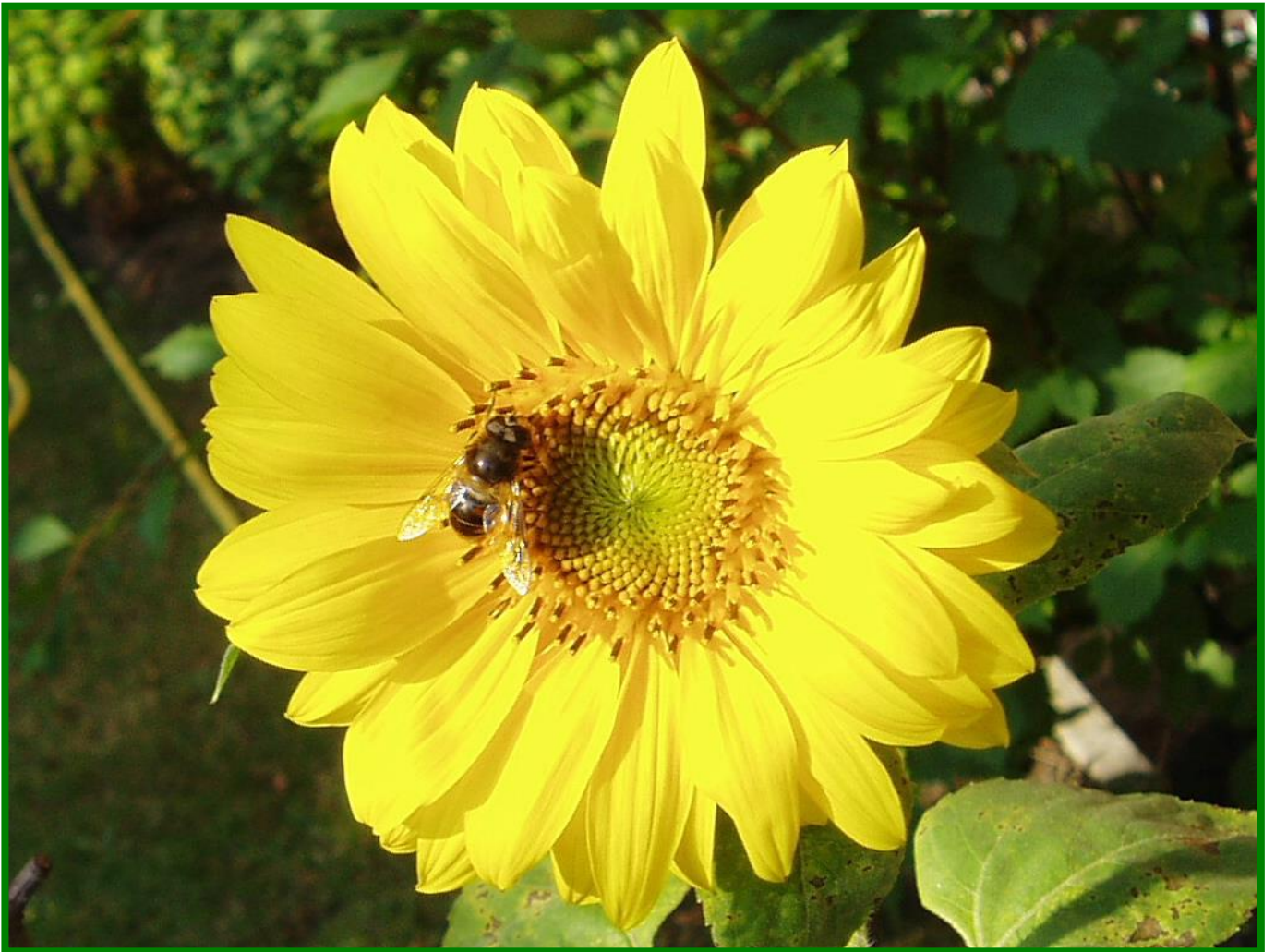
Sommerboten laden zum Wandern in die Landschaft. Bild oben Balbisi